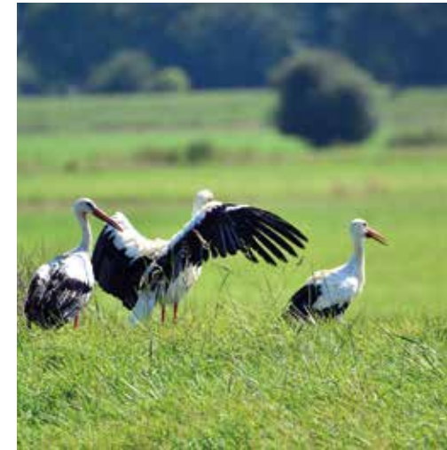
(4) Der Weißstorch brütet im Umfeld, er geht im Gebiet auf Nahrungssuche.