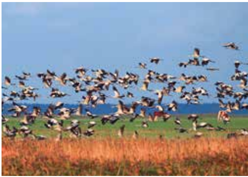
(1) Die Kraniche ziehen in großen Gruppen. Auf der Weschnitzinsel lassen sie sich zur Rast und Nahrungssuche nieder.