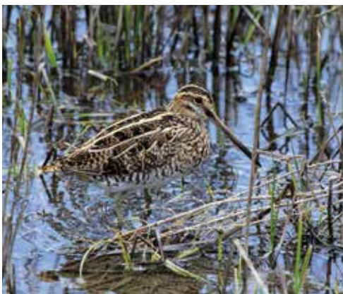
(3) Die Bekassine stochert in den matschigen Grabenrändern nach Nahrung.