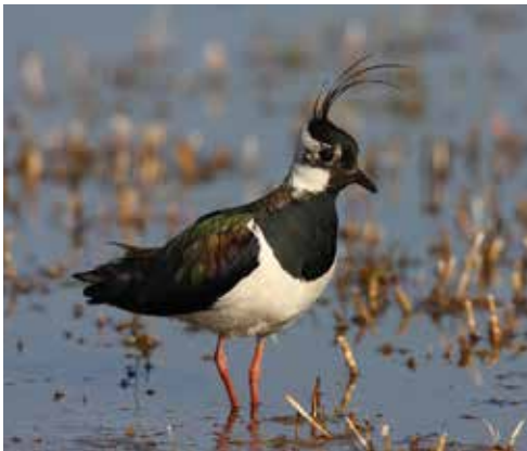
(2) Zahlreiche Kiebitze nutzen auf ihrem Zug das Naturschutzgebiet als Rastplatz.